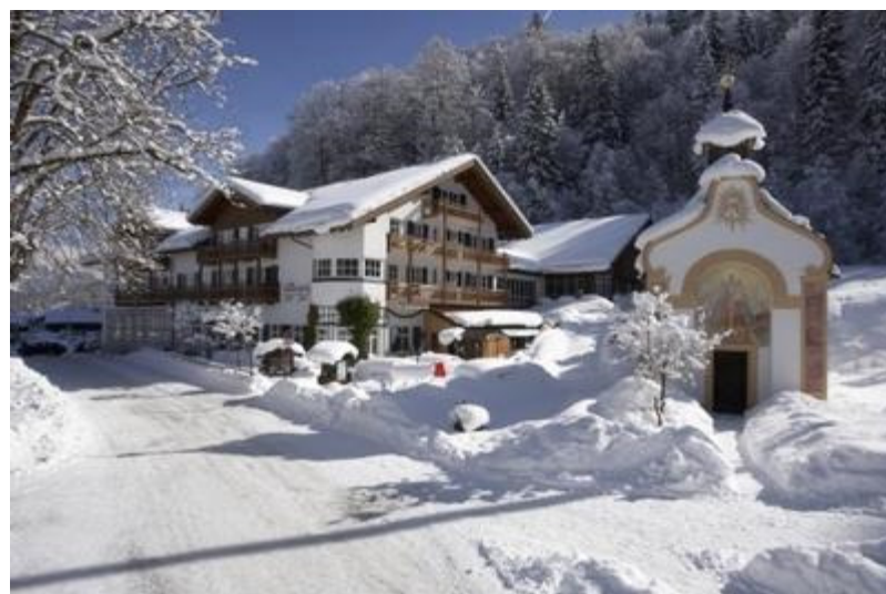
Meetings in the “Hotel Hammersbach” in Garmisch-Grainau