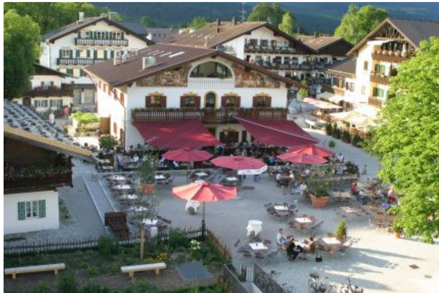
Opening and Prize Giving „am Mohrenplatz“